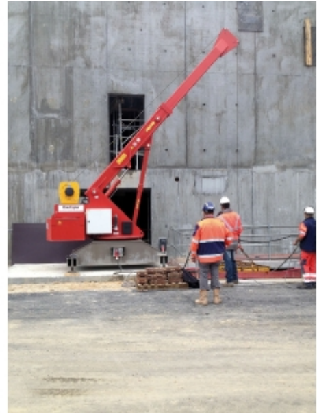
Travaux de réseaux