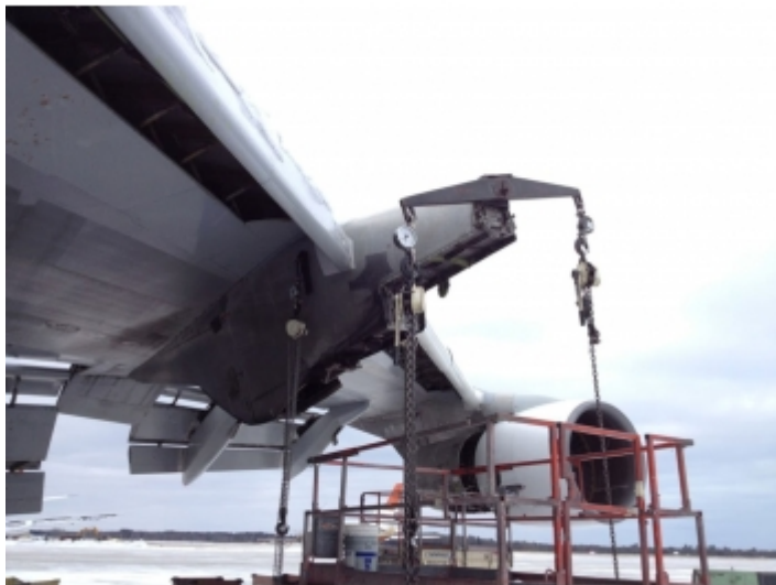
Peson en charge