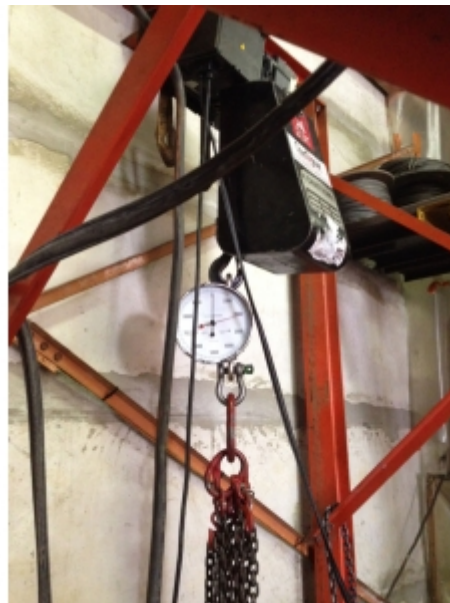
Réglage d'un limiteur de charge sur un palan électrique à chaîne