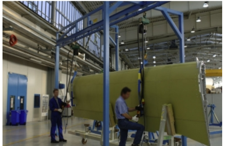
Installation sur une chaîne de montage