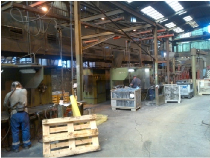
Installation sur une chaîne de montage