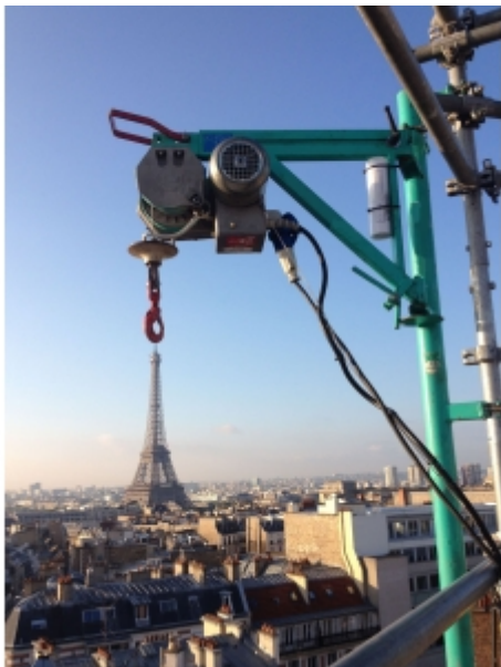
Treuil potence monté sur un étau d'échafaudage