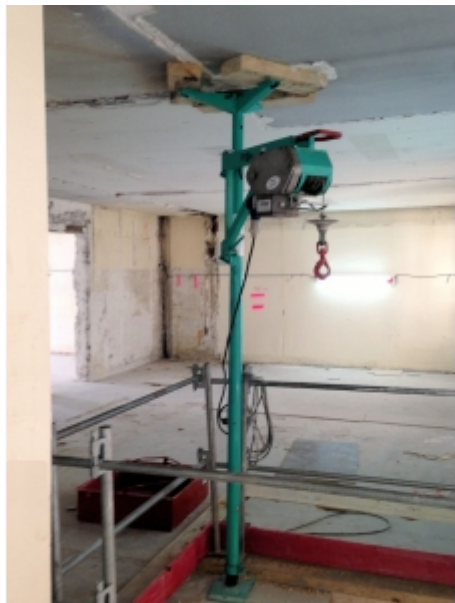
Treuil télescopique monté sur un étau d'intérieur