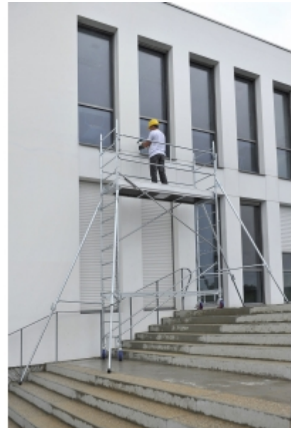
Rénovation d'une façade d'immeuble