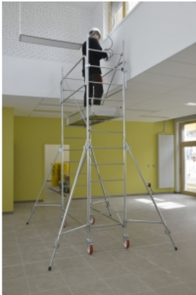
Installation en intérieur