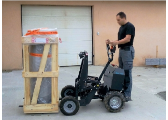
Déplacement d'une palette