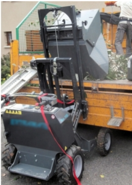
Transport de feuilles