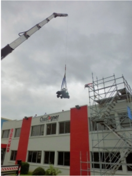
Levage d'un chariot électrique avec un camion-grue