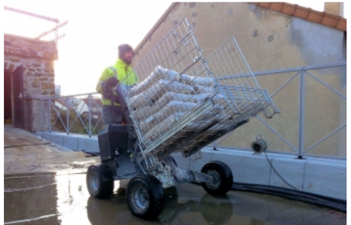
Déplacement d'une caisse-palette