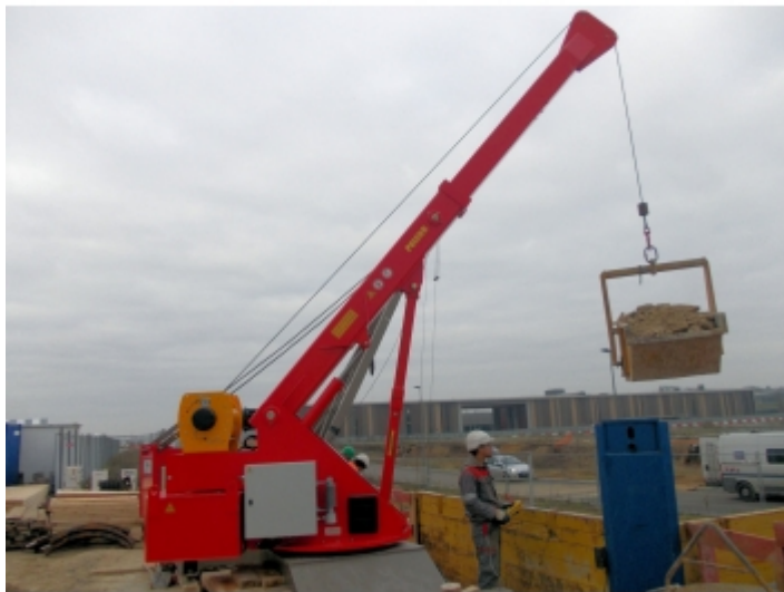
Travaux de réseaux