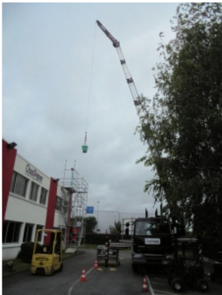
Levage avec un camion-grue