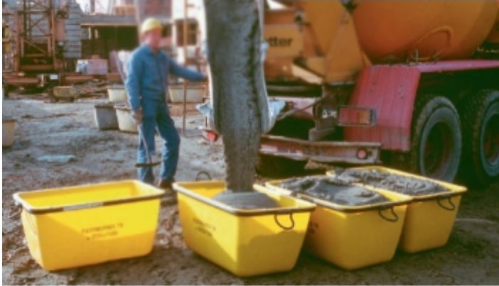
Manutention de mortier sur chantier