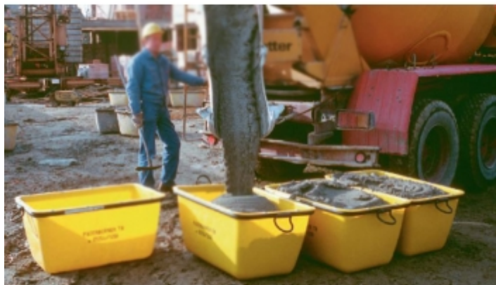
Manutention de mortier sur chantier