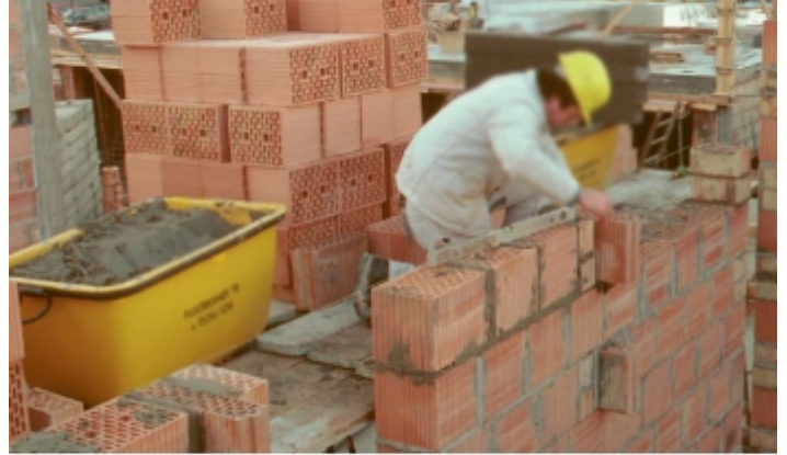
Manutention de mortier sur chantier